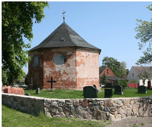
Dorfkirche Glienicke vor Beginn der Sanierung

Als gegen Ende des 18. Jahrhunderts die alte Fachwerkkirche in Glienicke (Landkreis Ostprignitz-Ruppin) baufällig geworden war, klagten die Einwohner des Ortes in einem Schreiben an den Landesherrn, dass sie „nur noch mit Lebensgefahr in die Kirche gehen“ könnten. Es dauerte einige Jahre, bis der zuständige Bauinspektor Friedrich Buchholz aufgefordert wurde, einen Neubau zu entwerfen. Dieser Entwurf gelangte über den preußischen Dienstweg auf den Schreibtisch des Leiters der Königlichen Ober-Bau-Deputation Karl-Friedrich Schinkel. Schinkel verwarf das Projekt, fertigte eigene Zeichnungen und ordnete an, dass die neue Glienicker Kirche „den Character einer kleinen