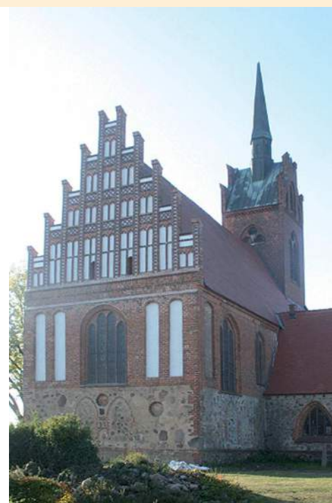
Ostgiebel der ehemaligen Wallfahrtskirche Alt Krüssow