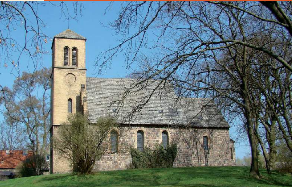
Dorfkirche Wegendorf (Märkisch Oderland), Fotos: Förderverein Dorfkirche Wegendorf