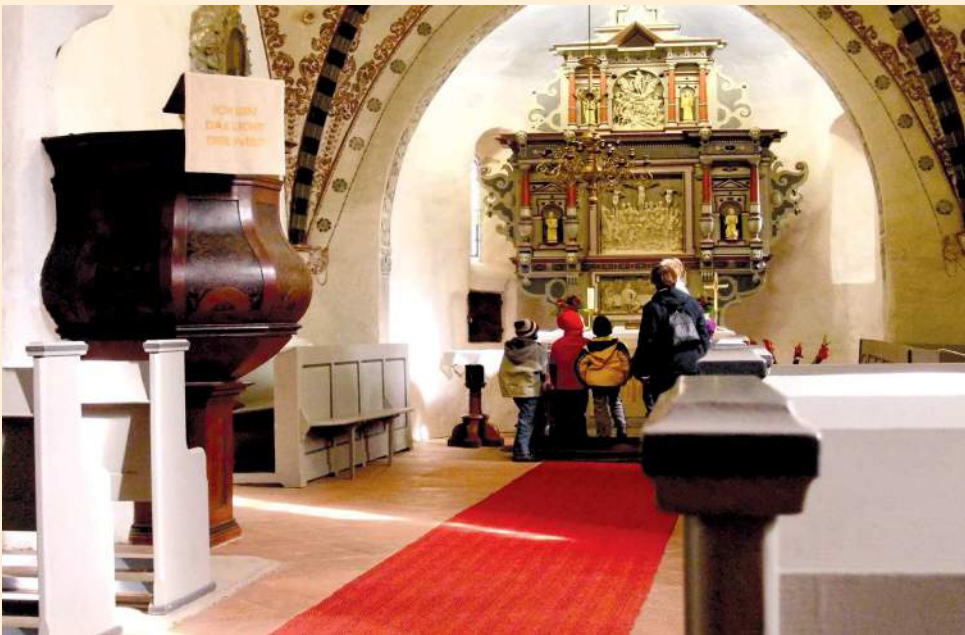
Kirchenführung für Kinder

das Kulturgut Kirche als einen Ort von Religion und Geschichte, von handwerklicher Kunst und Kultur, aber auch als ein Zeichen der Identifikation mit der Heimat zu bewahren und zu fördern.“ Zwei prallvolle Jahre für den Verein: mehrere Benefizkonzerte,