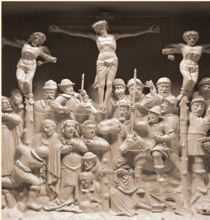
Detail des Altrarretabels, Kreuzigungsszene