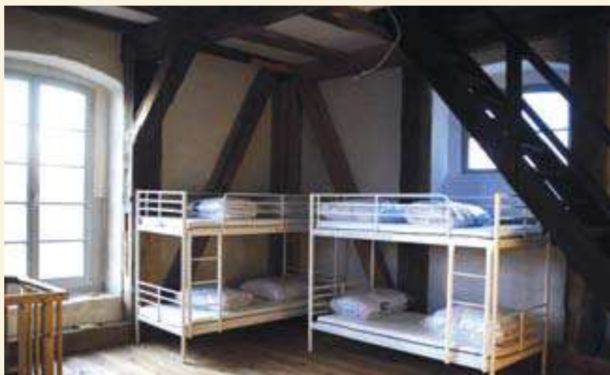
Pilgerherberge im Barsikower Kirchturm, Foto: Christian Richter

so aus, wie es sein soll. Inzwischen haben unsere Füße den Rhythmus gefunden und auch der Kopf arbeitet nicht mehr angestrengt, dass das nach nur vier Tagen schon passiert, haben wir nicht erwartet. Es tut sehr gut. Nach 28 Kilometern erreichen wir Wilsnack, unser Ziel und unseren Heimatort – wir sitzen in der Wunderblutkirche und erleben sie auf ganz andere Art und Weise als die vielen Male vorher. Der geschichtsträchtige Fußweg und die Tage der Ruhe haben ihren Anteil daran.