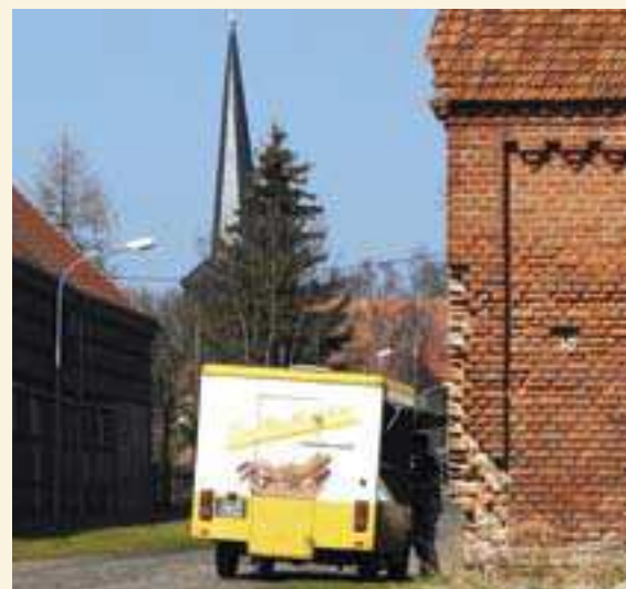
Verpflegungsfahrzeug in Garz (OPR)

durch das von der EU aufgelegte ILE-Programm – ein gutes Stück weiter. Frau Linke, unterdessen Ortsvorsteherin, blieb unermüdlich: Der Innenraum der Kirche, die Wiederherstellung der Decke, die Fenster – für alle anstehenden Reparaturen mussten neue Mittel durch Veranstaltungen, Spenden und Anträge aufgebracht werden. Im Juni 2012 war es dann endlich soweit: Die Kirche konnte – vollständig restauriert – feierlich wiederingeweiht werden. Beharrlichkeit und unermüdliches Bestreben aller Beteiligten haben sich für Barsikow und die Kirche mitten im Dorf gelohnt.