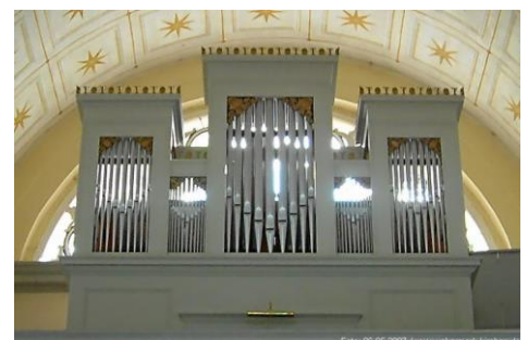
Annenwalde, Orgel, Foto: Siegfried Gräwer, uckermark-kirchen.de

1981 wurde die Schinkelkirche Annenwalde - 1835 erbaut - als baufällig eingestuft und entging nur knapp dem Abriss. Nach Notreparaturen begann 1991 eine grundlegende Sanierung des Innenraums, die 1995 abgeschlossen wurde. 2002 waren dann auch die Sanierung der äußeren Hülle, der Fassaden und des Dachs beendet. Die geringen Überstände der Biberschwänze über der Traufe führten dazu, dass das Wasser an der Fassade herabließ, sodass 2015 mit der Unteren Denkmal-schutzbehörde und der Kirchengemeinde nach Lösungen zu einer Verbesserung der Wasserführung gesucht wurde. Leider kam es bei den daraufhin folgenden Dacharbeiten durch ein Unwetter zu einem Wassereintritt auf der Nordseite. Am 21. Juli 2015 erlitt die wunderschöne Kirche Annenwalde einen Wasserschaden, der drei Jahre später längst beseitigt war, als der Orgelsachverständige der EKBO, Prof. Klaus Eichhorn, der das Instrument pflegende Orgelbauer Tobias Schramm, Pfarrer Fleischer aus Lychen und die Vorsitzende des Gemeindegemeinderats, Frau Weitkamp, die Orgel am 3. April 2018