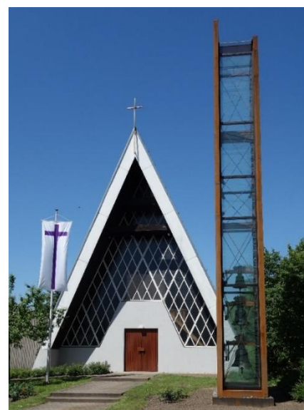
Glockenturm Ev. Matthäusgemeinde Sinzheim

Viel Mut bewies 2015 die evangelische Matthäusgemeinde im badischen Sinzheim bei Baden-Baden. Dort wurde der erste Kopfüber-Glockenturm errichtet. Weder in Deutschland noch Europa habe es bislang Ähnliches gegeben, sagt Kares. Ein Patent habe er aber nicht beantragt. Denn möglichst viele Gemeinden sollten von der kostengünstigen Idee profitieren und Glocken weiterhin ein „flächendeckendes Kommunikationsmittel der Kirche“ bleiben.