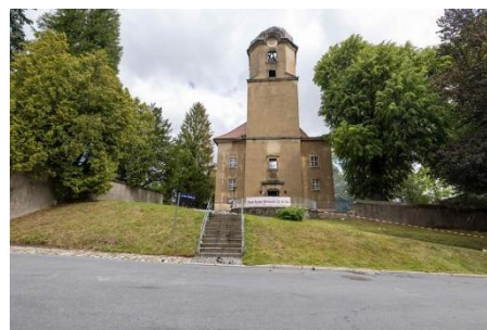
Kirche Großröhrsdorf nach dem Brand im August 2023

04.03.2024: epd-Wochenspiegel Ost Nr. 10/2024: Hohe Haftstrafe nach Kirchenbrand. Mehr als sechs Monate nach dem verheerenden Kirchenbrand im sächsischen Großröhrsdorf ist der mutmaßliche Täter am 27. Februar zu einer neunjährigen Freiheitsstrafe verurteilt worden. Die Kammer des Landgerichtes Görlitz sah es als erwiesen an, dass der Angeklagte Maik H. am 4. August 2023 einen Brand in der evangelischen Stadtkirche gelegt hat. Das Gebäude brannte vollkommen aus. Die Kammer geht von schwerer Brandstiftung aus. Laut Kammer litt der Mann nach der Trennung von seiner Ehefrau und drei Kindern unter einer schwierigen Lebenssituation. Von einer Schuldunfähigkeit gingen die Experten aber nicht aus. Die Kammer urteilte, dass er sich seiner Taten bewusst war und planvoll vorging. Die Schadenssumme wird nach ersten Schätzungen auf rund 35 Millionen Euro beziffert. Bei dem Brand waren zahlreiche historische Kunstschatze zerstört worden, darunter eine geschnitzte Madonna aus dem 15. Jahrhundert und eine Nachbildung des Altars der Leipziger Thomaskirche. In Großröhrsdorf soll wieder eine Stadtkirche gebaut werden - in welcher Form, ist noch offen. Rund 480.000 Euro an Spenden kamen bereits zusammen.