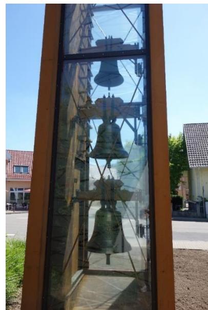
Glockenturm Sinzheim