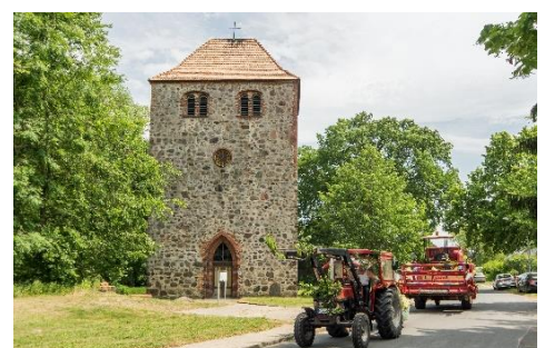
Kirche Batzlow beim Dorffest 2015