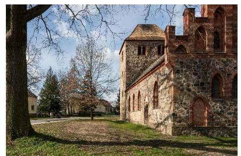
Kirche Batzlow März 2024

Die Kirche gehört zur Gemeinde Märkische Höhe im Landkreis Märkisch-Oderland und ist eine der am intensivsten genutzten Kirchen der Gesamtkirchengemeinde Haselberg. Alle 14 Tage finden in der Ortskirche Reichenow-Batzlow-Möglin Gottesdienste auch mit Unterstützung eines Lektors statt. Eine gute Zusammenarbeit mit dem Ortsverein, der Freiwilligen Feuerwehr, der Kommune und dem ansässigen Gewerbe ist der Gemeinde sehr wichtig. So unterstützt man sich beim Martinsfest, betreut Konzerte mit anschließendem Kaffeetrinken in der Kirche und greift sich gegenseitig unter die Arme. Auch katholische Gemeindeglieder bringen sich aktiv ins Gemeindeleben ein. Vor vier Jahren wurde der Gemeinde ein Klavier geschenkt. Seitdem wird das Instrument gespielt und vom ortsansässigen Klavierstimmer gestimmt.