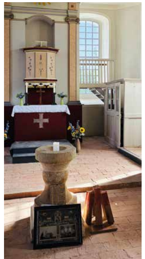
Innenraum der Dorfkirche Kosilenzien

Als man sich im Jahr 2020 eigentlich nur mal den Dachstuhl genauer anschauen wollte, lagen danach geschätzte Kosten für eine Sanierung in Höhe von ca. 400.000 Euro auf dem Tisch. Der gesamte Dachstuhl musste erneuert werden, auch die Fenster, und auch das Mauerwerk musste trockengelegt werden. Es wurde eine Toilette in das Gemeindehaus eingebaut und auch dessen Dachstuhl brauchte Unterstützung. Der Großteil der Kosten wurde