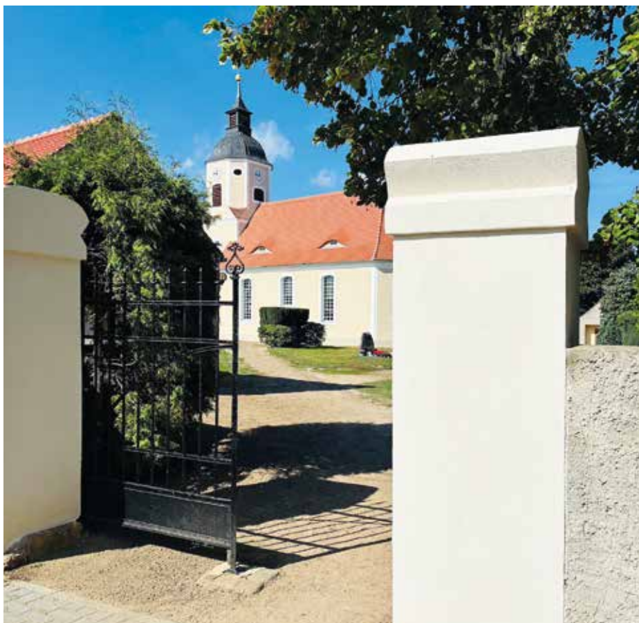
Kirche mit Kirchhof in Kosilenzien