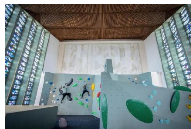
Kletterkirche im hessischen Bad Orb

06.04.2026: Susanne Schröder in epd-Wochenspiegel Ost Nr. 15/2026: Kirchen in Deutschland: Suche nach neuen Konzepten für Sakralgebäude . Seit 2015 haben die evangelische und die katholische Kirche in Deutschland knapp 1.000 Kirchen umgenutzt oder verkauft. Aktuell gibt es noch rund 44.000 Gotteshäuser. Viele Bistümer und Landeskirchen rechnen aber mit einer Reduzierung des Bestands. Seit 2015 sind rund 1.000 Gotteshäuser umgenutzt, verkauft oder abgerissen worden, wie eine Umfrage des Evangelischen Pressedienstes (epd) bei den 20 evangelischen Landeskirchen und 27 katholischen Bistümern ergeben hat. Bei den Protestanten liegt die Evangelische Kirche im Rheinland (EKiR) mit 180 entwidmeten Kirchen und Gottesdiensträumen seit 2015 an der Spitze, gefolgt