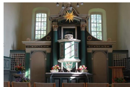
Altar der Dorfkirche Niederfinow