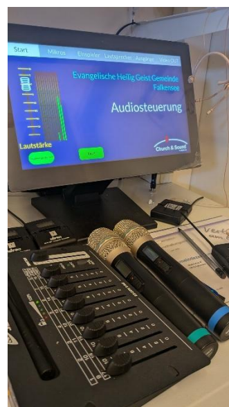
Schaltpult der Schwerhörigen-Anlage in Heilig Geist Falkensee.