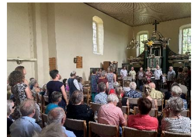
Konzert des Fahlberg-Chores in der Dorfkirche Niederfinow

In Niederfinow (Barnim) hat sich im Oktober 2025 der Förderverein Dorfkirche Niederfinow e.V. gegründet. Ihm gehören inzwischen 19 Mitglieder an. Ein zentrales Anliegen ist es, die Dorfkirche auch über den kirchlichen Rahmen hinaus als offenen Treffpunkt und lebendigen Ort der Begegnung im Dorf zu erhalten. Dazu gehören die Unterstützung von Sanierungs- und Umbaumaßnahmen ebenso wie die Organisation vielfältiger Veranstaltungen. Der Förderverein versteht sich als Bindeglied zwischen Kirchengemeinde, Gemeinde und den Einwohnerinnen und Einwohnern Niederfinows. Ziel ist es, die Dorfkirche als identitätsstiftenden Ort zu bewahren und zugleich behutsam neue Nutzungsperspektiven zu entwickeln. Dabei sollen gemeinsam mit den Beteiligten vor Ort und in enger Abstimmung mit der evangelischen Lukasevangeliumsgemeinde Oberbarnim tragfähige und zukunfts-orientierte Nutzungskonzepte erarbeitet werden.