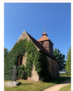
Dorfkirche Niederseefeld

30.06.2025: epd-Wochenspiegel Ost Nr. 27/2025: Brandenburgs Dorfkirche des Monats steht in Niederseefeld im Landkreis Teltow-Fläming . Der aus robusten Feldsteinen gebaute spätgotische Sakralbau sei ein besonderes Wahrzeichen des Ortes im Niederen Fläming, teilte der Förderkreis Alte Kirchen Berlin-Brandenburg mit. Das Baumaterial für die Kirche aus dem 15. Jahrhundert sei aus unzähligen Findlingen und sogenannten Lesesteinen gewonnen worden, die während der zurückliegenden Eiszeit aus Skandinavien in die Region gelangten. Um die Dorfkirche von Niederseefeld auch in Zukunft nutzen zu können und das über Jahrhunderte gewachsene kulturelle Erbe für kommende Generationen zu bewahren, brauche die Kirche nun Unterstützung. Es seien umfangreiche Sanierungsmaßnahmen nötig. So zeige das Fachwerk des Turms zum Teil Schäden durch Verwitterung, die Mauerwerksgefache drohten sich herauszulösen. Der Giebel muss neu verputzt werden.