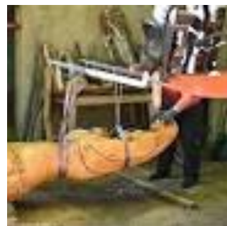
Maria - noch in der Werkstatt