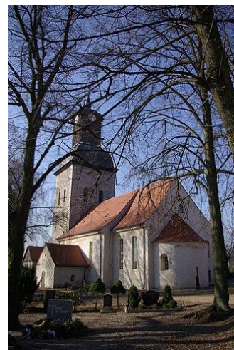
Dorfkirche Heinersdorf b. Steinhöfel