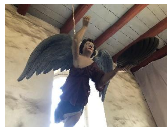
Taufengel in der Dorfkirche Kossin