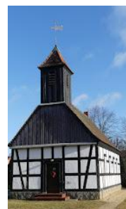
Kirche Nexdorf, Foto: George Charleston

24.07.2025: Franziska Dorn in Nachrichten aus dem Kirchenkreis Niederlausitz: Historische Gruft auf dem ehemaligen Friedhof in Nexdorf entdeckt. Bei der Rasenpflege auf dem ehemaligen Friedhof rund um die Kirche in Nexdorf brach ein Teil der Erde ein und legte eine historische Gruft frei. Es scheint, dass dort zwei Personen bestattet wurden. Eine der Bestattungen ist in einem noch erhaltenen Sarg aus Eichenholz, während die zweite, vermutlich früher bestattete Person, in einem Sarg liegt, der bereits erheblich zersetzt ist. Die Gruft ist mit einer gemauerten preußischen Kappe versehen. Die Wände der Gruft sind geputzt und gestrichen. Besonders auffällig ist der umlaufende schablonierte Oberwandfries, der mit einer Blattranke verziert ist und von Experten auf das frühe 20. Jahrhundert datiert wird. Die Verantwortlichen der Evangelischen Hoffnungskirchengemeinde Trebbus und Umland haben nun entschieden, die Gruft zu sichern und zu erhalten.