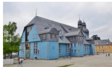
Die beim Brand beschädigte Holzkirche