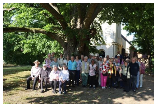
Exkursionsgruppe vor der 300-jährigen Linde an der Kirche Wustrau

An einem der wenigen heißen Julitagen fuhren 38 Personen mit dem Reisebus nach Neuruppin und machten zuerst Station in der Kulturkirche in Neuruppin, einem Beispiel für eine „neue“ Nutzung. Aufgrund aktueller Einsturzgefahr wurde die Kirche 1978 geschlossen. Nach dem Ende der DDR wurde sie ab 1991 gesichert und zur Kulturkirche umgebaut. Von dort ging es weiter zur Klosterkirche St. Trinitatis, einer der wertvollsten Beispiele spätgotischer Baukunst im Ruppiner Land. Umfassende Restaurierungsarbeiten erfolgten 1949 und 1980. Heute befindet sich das denkmalgeschützte Gebäudeensemble in Privatbesitz. Nach dem Mittagessen fuhr die Gruppe zur mittelalterlichen Feldsteinkirche ins kleine Gnewikow. Das heutige Gebäude wurde im 15./ 16. JH. fertiggestellt, die Ausstattung stammt aus dem 17. Jh. Als Förderkreis fördern wir hier zurzeit die Instandsetzungsarbeiten am Kirchturm. Von hier ging es weiter nach Radensleben, wo die Gruppe ein rechteckiger Feldsteinbau erwartete. 1865-1870 erfuhr die Kirche eine durchgreifende Restaurierung und Neugestaltung durch Ferdinand von Quast. Altar, Kanzel und Ambo sind aus Terrakotta im italienischen Renaissancestil. Die historische Raumfassung konnte im Jahr 2022 wiederhergestellt werden. Zu bewundern waren außerdem die Glasmalereien von 1864/70. Nach dem Kaffeetrinken besichtigte die Gruppe als letzte Station die Dorfkirche Wustrau mit ihrer besonderen Ausstattung, einem spätgotischen Schnitzaltar (von 1470/80) und