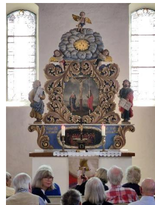
Reisegruppe in Paplitz